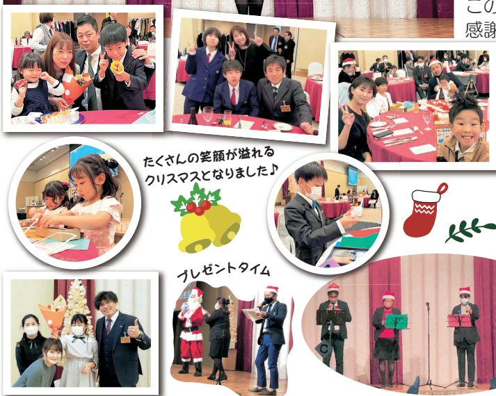
たくさんの笑顔が溢れるクリスマスとなりました♪