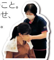
マッサージやアロマディフューザー作りで癒やしの一時を

例会では、おもてなしタイムとして、ご家族用にマッサージなどのリラックスブースを用意し、お子様にはチェキ(インスタントカメラ)での写真撮影からフォトフレーム制作体験などでとても楽しんでいただきました。また、クリスマスということで、サンタさんを司会に迎えての会員協賛ワクワクプレゼントタイムもあり、終盤には、普段は照れてしまってなかなか言えない思いを届けるため、会員から大切な皆様への感謝の気持ちを込めたメッセージカード贈呈も行われました。