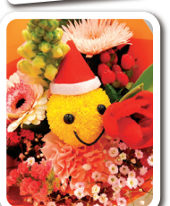
牧野会長から奥様方へお花のプレゼントも♪