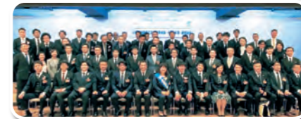
令和4年度 通常総会