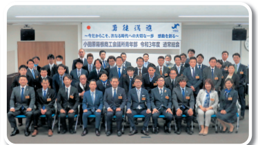
令和3年度 通常総会