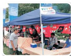
ネイチャーフェスタ