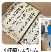
小田原ちょうちゃん 製作指導教室