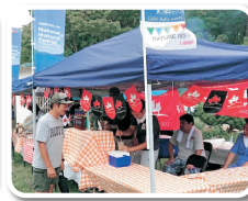
ネイチャーフェスタ