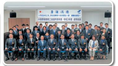
令和3年度 通常総会