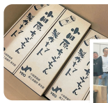
小田原ちようちゃん 製作指導教室