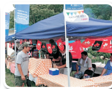
ネイチャーフェスタ