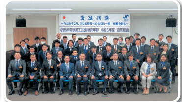
令和3年度 通常総会